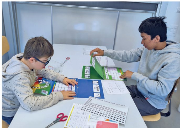
Lernmoment im Schulalltag

Sein Wochenplan ist dicht: vier bis sechs Schneetrainings, dazu Athletikeinheiten sowie im Sommer intensives Downhillbiken – seine zweite grosse Leidenschaft. Es ist ein anspruchsvolles Programm, zumal er auch schulisch gefordert ist und unter anderem im Sportunterricht der Regelschule teilnimmt.