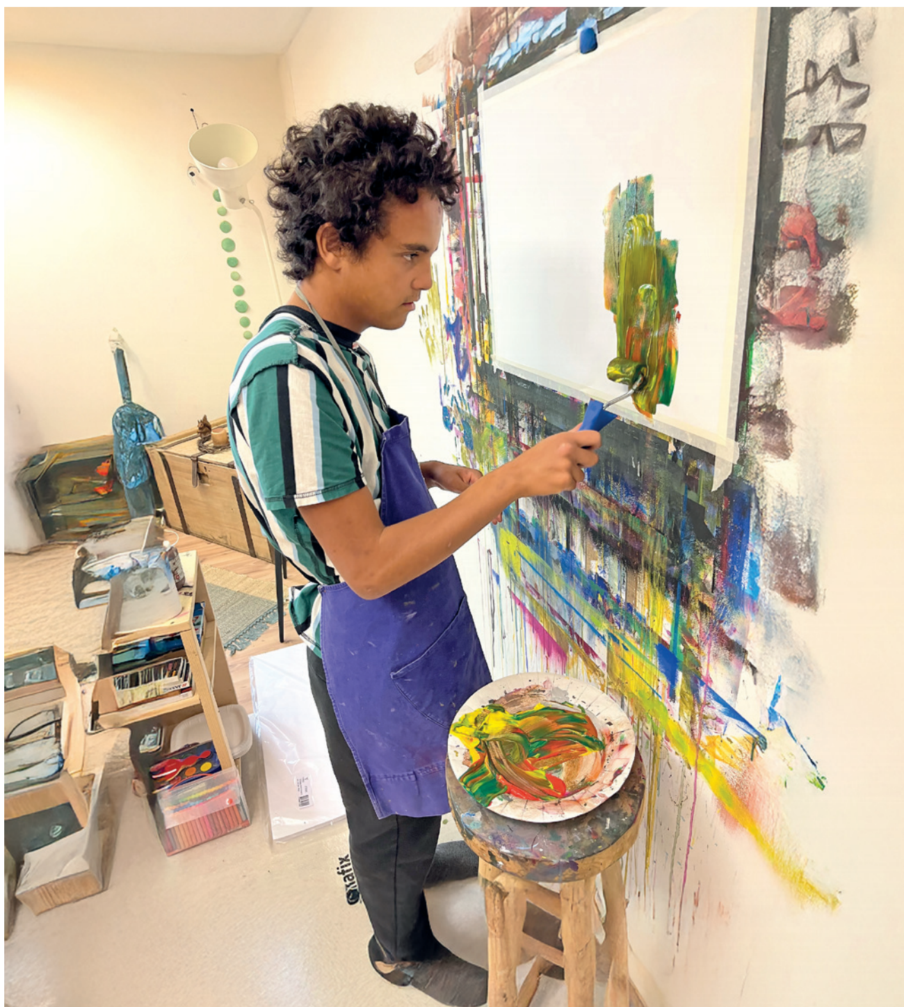
Kreativer Moment im Atelier

Vernissage der Wohngruppe Foppa in Tartar